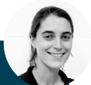
Marion Ingegnere prodotto

Questa nuovissima bicicletta Elops 920E Connect è dotata di una potente frenata idraulica, di una trasmissione integrata e di un sistema di geolocalizzazione in tempo reale. Niente più stress per il furto della tua bici! Con la nostra applicazione, pedali in tutta sicurezza e in caso di furto ritrovi la tua bici. Buon tragitto!