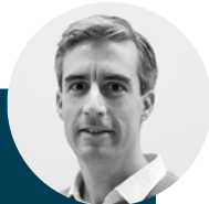
Éric Capo Prodotto

Questa prima bici Decathlon connessa è soprattutto una risposta efficace contro il furto delle bici e per rendere la bici elettrica una concreta alternativa sostenibile ai veicoli a motore termico. Questa soluzione tecnica consente di beneficiare di nuovi servizi di cui non è possibile usufruire con una bici NON-connessa. Sono delle bici con intelligenza aumentata ed evolutiva che contribuiscono a rendere l'esperienza in bici più piacevole, sicura e pratica ogni giorno.