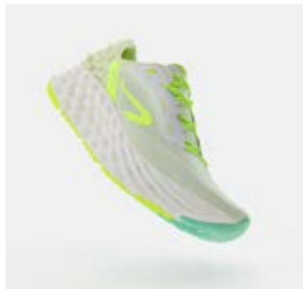
KS900.2 MEN - YELLOW GREEN

Le squadre di design KIPRUN hanno sviluppato per ogni modello delle misure da uomo e da donna. Per soddisfare meglio i bisogni delle runner, il tallone è più sottile rispetto alla stessa misura del modello uomo; lo stesso vale per il perimetro del metatarso, la zona di flessione della scarpa.