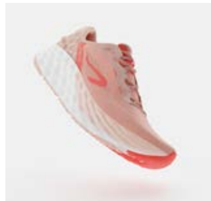
KS900.2 WOMEN - WHITE CORAIL