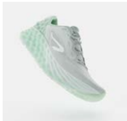
KS900.2 WOMEN - GREY GREEN