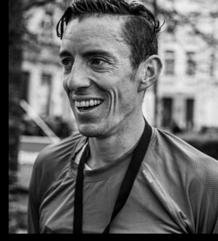
Yoann KOWAL KIPRUN Athlete

Una scarpa molto apprezzata ai più alti livelli!