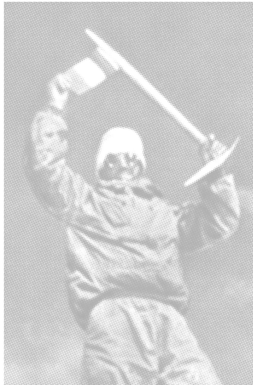
ANAPURNA FIRST ASCENT MAURICE HERZOG 1950

Nelle mani e sotto i piedi di tantissimi alpinisti, la firma Simond ha accompagnato le imprese del passato... e continua a ispirare quelle di domani.