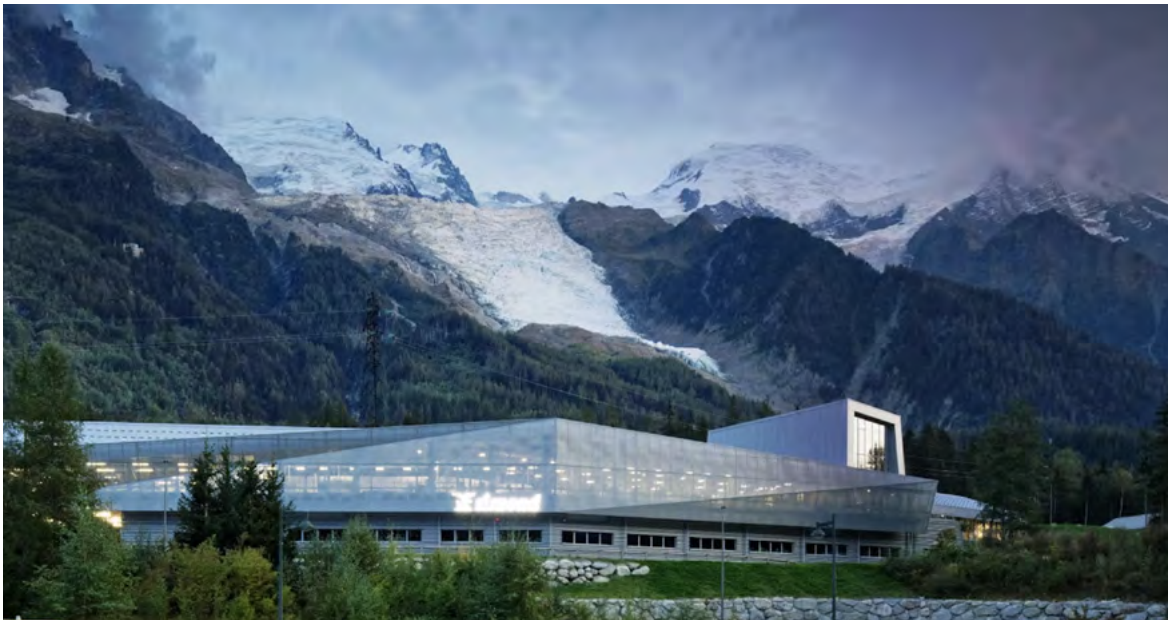
THE BASE CAMP

Ai piedi del Monte Bianco, il Campo base di Simond è molto più di un sito produttivo. È un luogo dove design, innovazione, artigianalità e trasmissione si incontrano, uno spazio vivente dedicato alla passione per la montagna in tutte le sue forme. Qui, le squadre progettano e producono l'attrezzatura Simond, oltre a testare e perfezionare ogni linea di prodotto: corde, imbraghi, zaini, abbigliamento, caschi, scarpette da arrampicata, scarponi da alpinismo, tende e altro ancora.